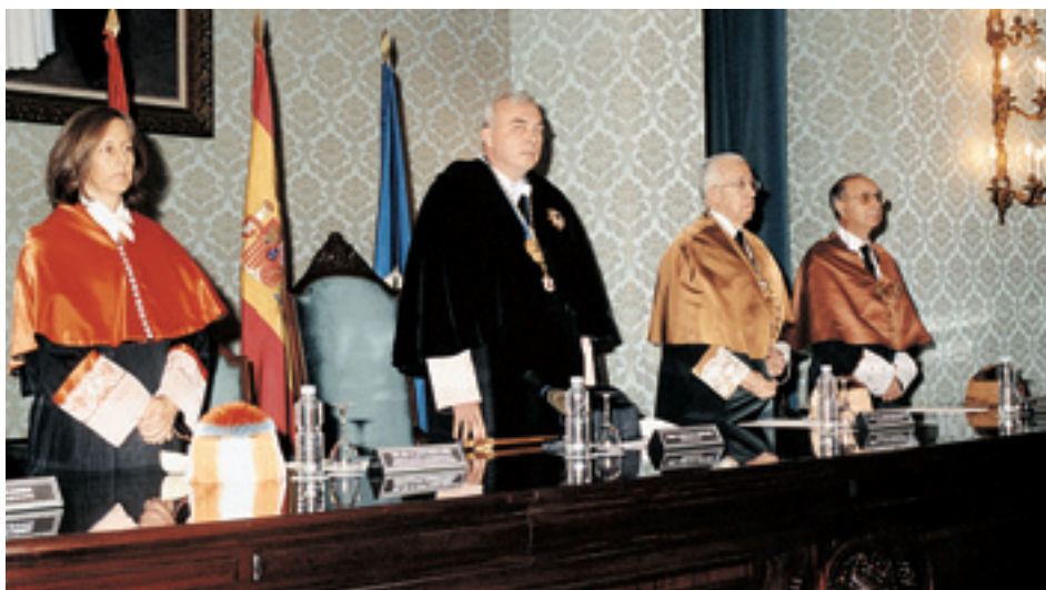
Acto de inauguración del curso 2004-2005.